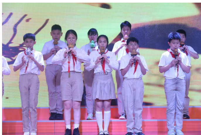
葫芦丝演奏《听我说谢谢你》

毕业生们用歌声、朗诵和弹奏等形式，展现了他们的才华和青春活力。每一个节目都凝聚了同学们的心血和汗水，也让我们看到了他们无限的潜力和可能。